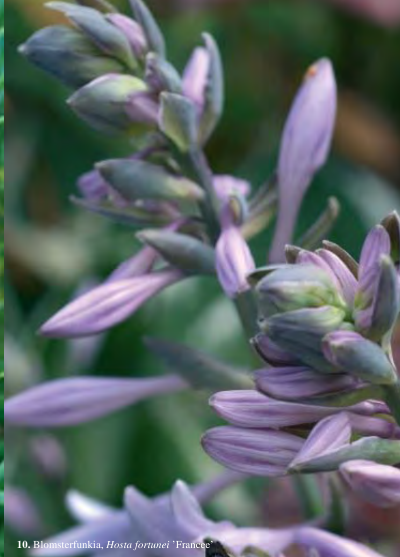
10. Blomsterfunkia, Hosta fortunei 'Francee'

Städa måttligt i rabatten, och aldrig på hösten. Växternas blad ger vintertäckning och hinner också brytas ner en del under vintern. Om höstlöv fastnar i bladverken är det bara bra. Växtresterna ger jorden ett extra tillskott av mull. Klipp ner perennerna tidigt på våren och städa varsamt i rabatten. Löv som du lämnar kvar tar snart maskarna hand om.