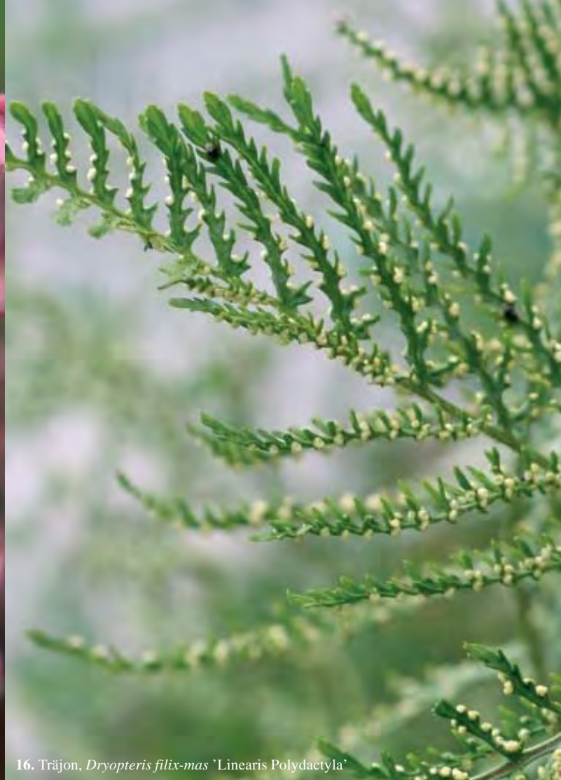
16. Träjon, Dryopteris filix-mas 'Linearis Polydactyla'