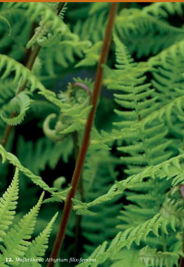
12. Majbräken, Athyrium filix-femina