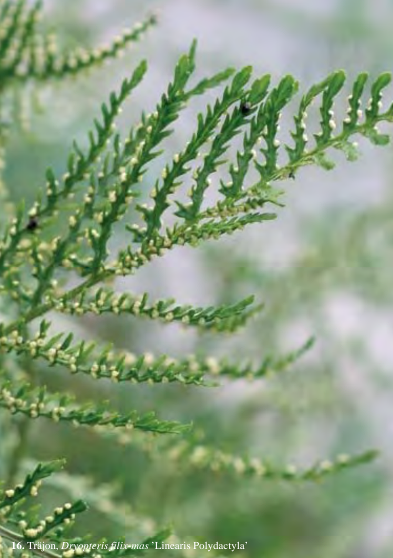
16. Träjon. Dryopteris filix-mas 'Linearis Polydactyla'