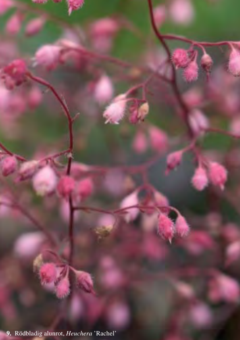
9. Rödbladig alunrot, Heuchera 'Rachel'