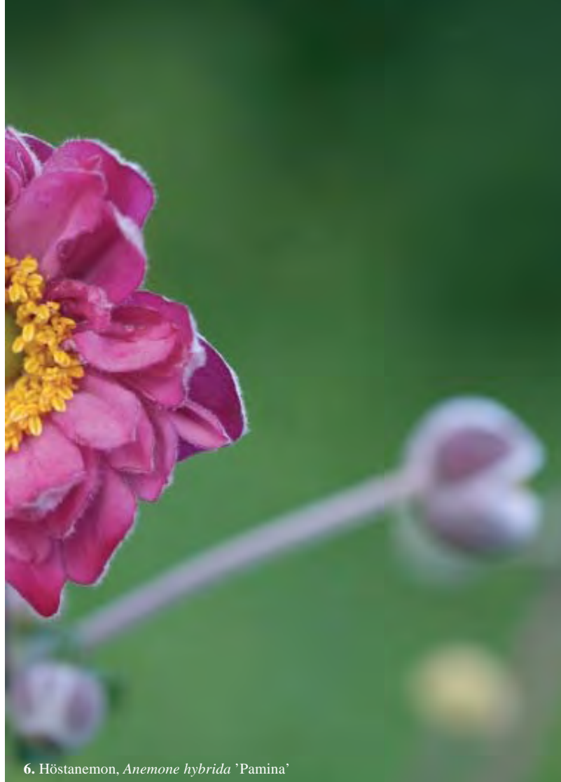
6. Höstanemon, Anemone hybrida 'Pamina'

I förslaget är växterna planterade relativt tätt. Detta för att de snabbt ska täcka jorden. En yta som är täckt av växter är både vackrare och mer lättskött än öppen jord. Bland annat har ogräsfrön svårare att komma ner till jorden och gro. Men när perennerna vuxit till sig kan det bli aktuellt att gallra dem lite. Ta bort någon planta, eller delar av flera plantor, för att ge mer plats åt andra.