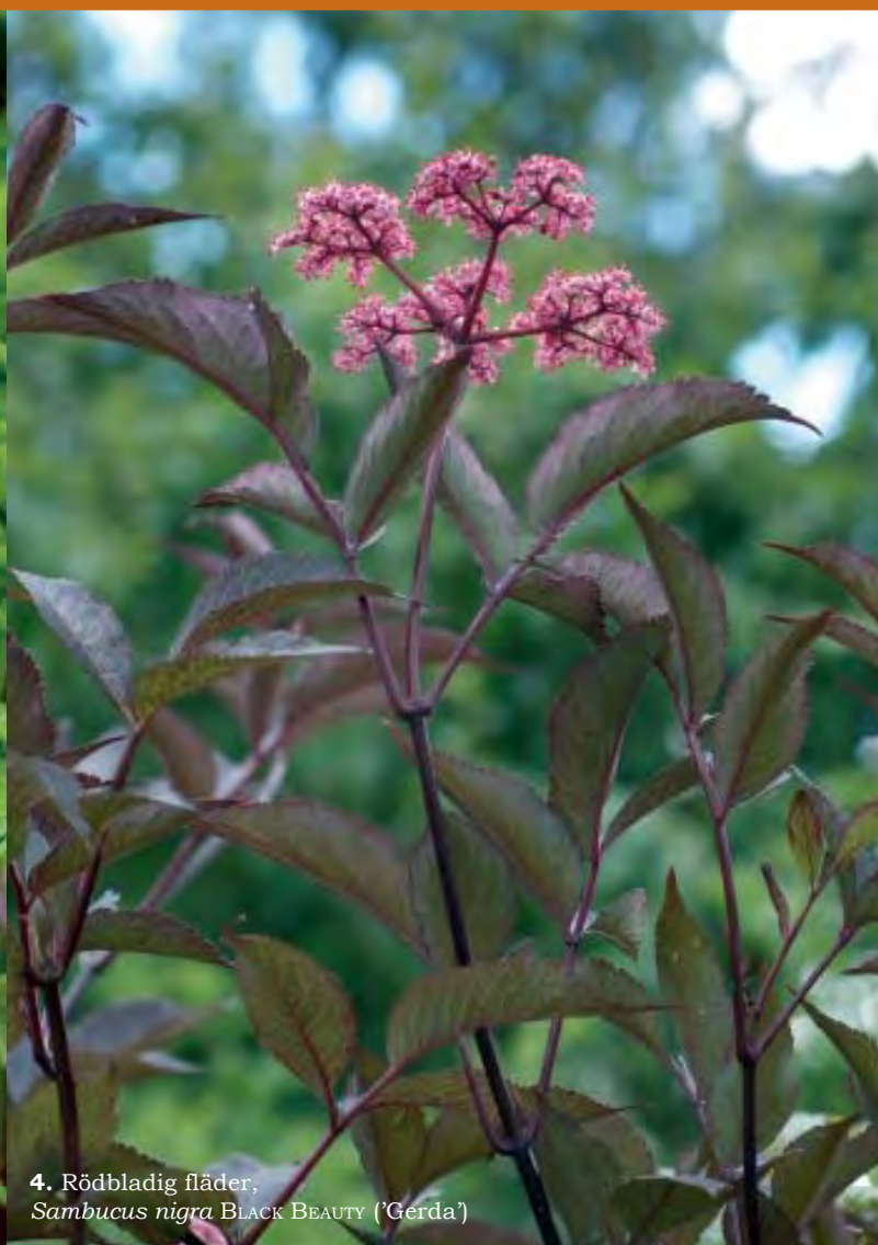
4. Rödbladdig fläder, Sambucus nigra BLACK BEAUTY ('Gerda')