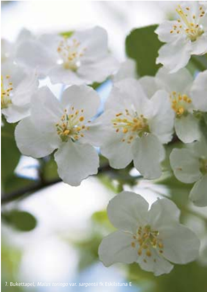
7. Bukettapel, Malus toringo var. sargentii fk Eskilstuna E