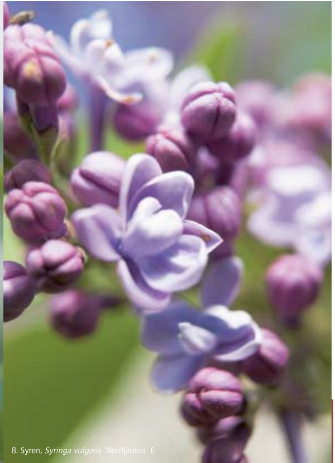
8. Syren, Syringa vulgaris 'Norrfjärden' E