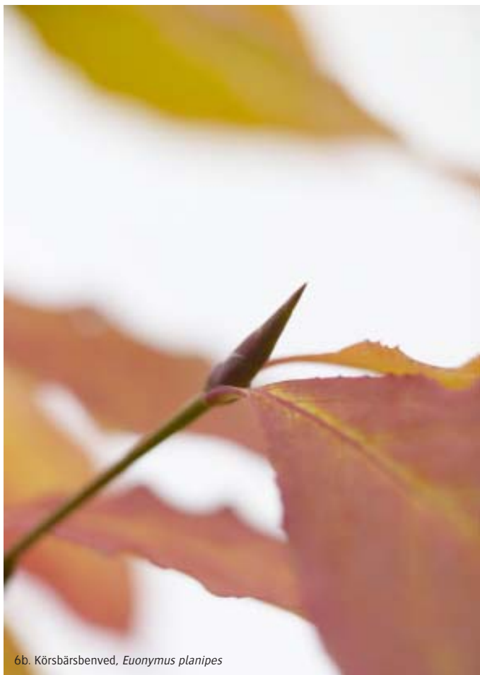
6b. Körsbärsbenved, Euonymus planipes