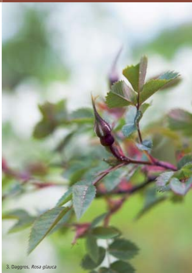
3. Daggros, Rosa glauca