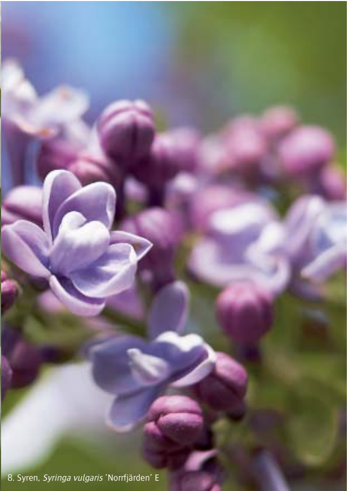
8. Syren, Syringa vulgaris 'Norrjärden' E