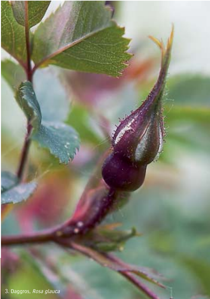
3. Daggros, Rosa glauca