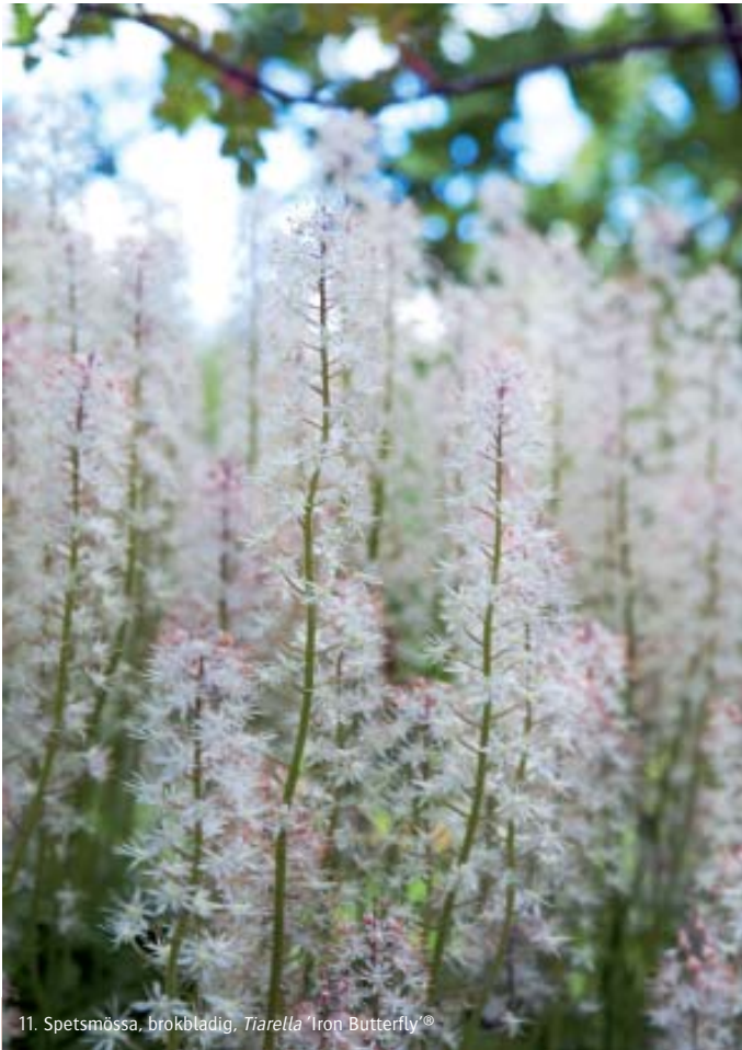
11. Spetsmossa, brokbladig, Tiarella 'Iron Butterfly' ®